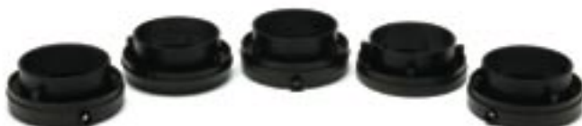
Les anneaux d'adaptation sont conçus pour chacune des marques populaires de compteurs