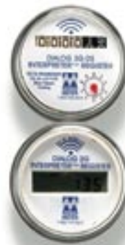
Registres analogue et numérique

La technologie de l'INTERPRETER permet de s'adapter à tous les ratios de couple magnétique de n'importe quel compteur concurrent. Sans limitation, la compatibilité de l'INTERPRETER existe avec les compteurs NEPTUNE, AMCO/ELSTER, BADGER, et SENSUS ainsi que les principales marques aux normes ISO, grâce à un anneau d'adaptation inviolable conçu pour chacune des marques populaires de compteurs auquel s'enclenche parfaitement l'INTERPRETER et le capot du registre.