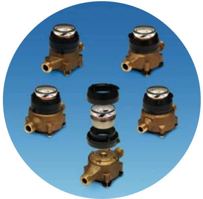
Compteurs de marques populaires avec registres INTERPRETER numériques

L'INTERPRETER est compatible avec la plupart des compteurs des fabricants suivants :