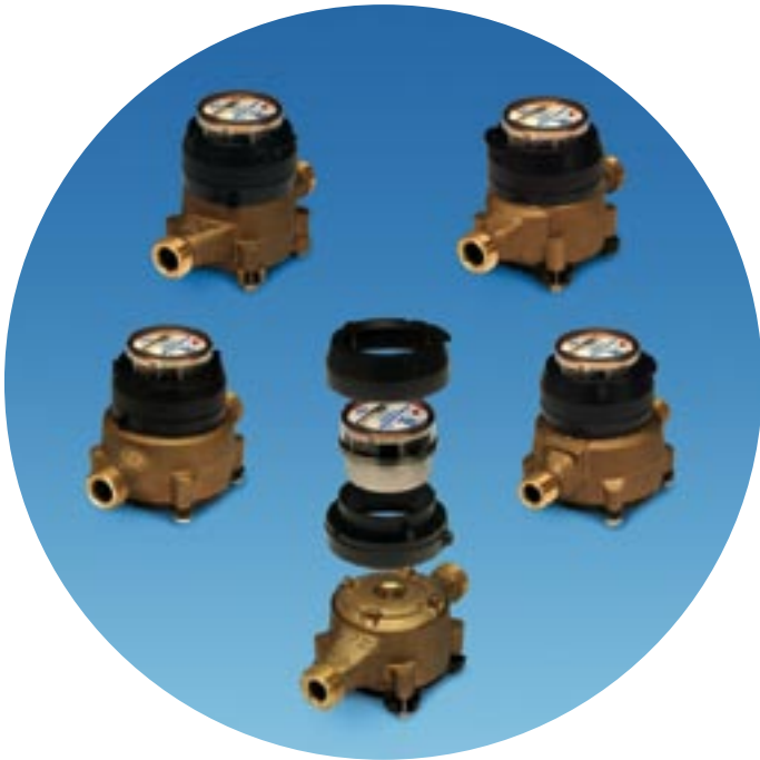
Compteurs de marques populaires avec registres INTERPRETER analogues